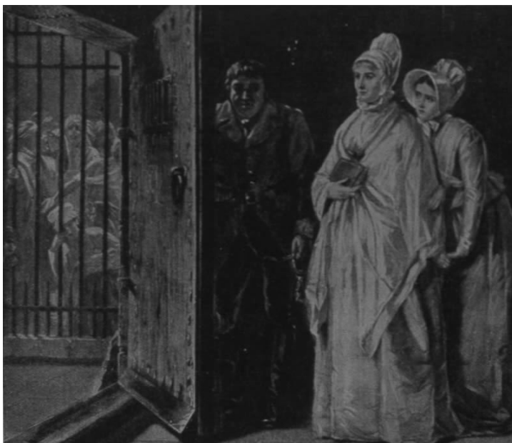
Incisione di Elizabeth Fry. Presa da Fry and Gurney "A Tour of Prisons in Scotland and the North of England" 1819. (DUL ref Routh 64 C 25)

che ne era affetta. Nel 1750 due carcerati con la febbre da galera sparsero la malattia nel quartiere di Old Bailey a Londra, uccidendo più di 50 persone. L'indice di mortalità delle carceri era generalmente alto. Fu stimato dal "The Gentlemen's Magazine" nel 1759 che uno su quattro dei carcerati moriva ogni anno. Questo ammontava a circa 5000 morti l'anno, un numero enorme se si considera che solo 200 carcerati venivano giustiziati ogni anno.