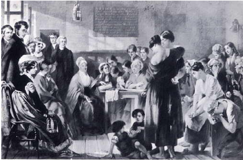
ELIZABETH FRY READING TO THE PRISONERS AT NEWGATE, 1823